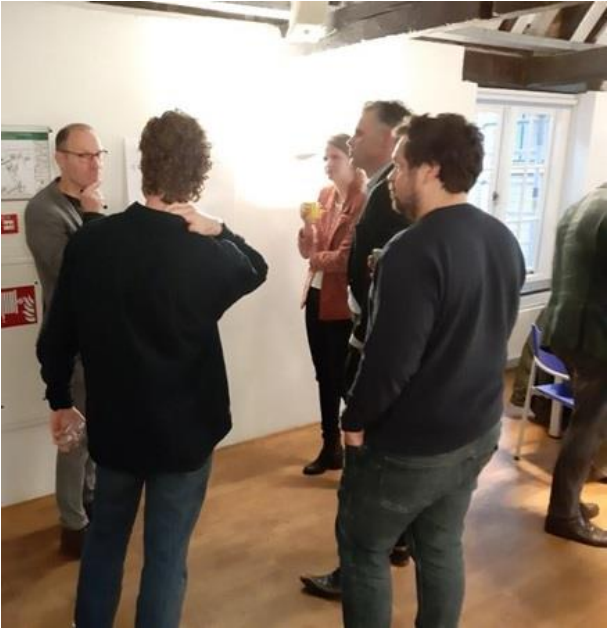
Figuur 3. De partijen in gesprek met elkaar en de gemeente.