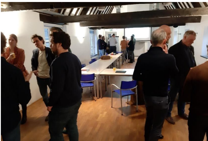
Figuur 1. De partijen in gesprek met elkaar tijdens de brainstormsessie.

Hier zijn meerdere interessante punten naar voren gekomen die in het eindverslag van GBN Advies mee worden genomen. Dit eindverslag is de basis voor een besluit of we in Amersfoort verder gaan met de Grondstoffencorridor. Dit hopen we op 4 maart scherp te krijgen met de wethouder. Als het een "go" wordt gaan we met de ketenpartijen via workshops aan de slag de Amersfoortse Grondstoffencorridor vorm te geven.