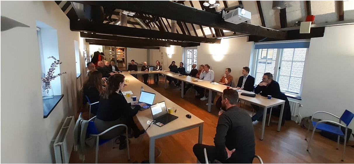
Figuur 2. De partijen zitten met elkaar rond de tafel.