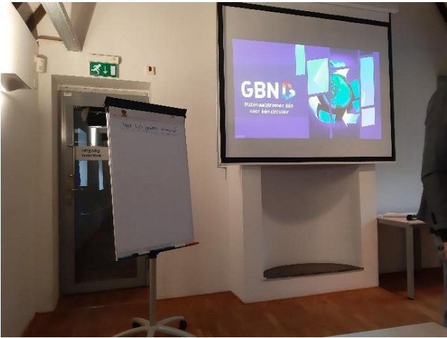
Figuur 4. Presentatie.